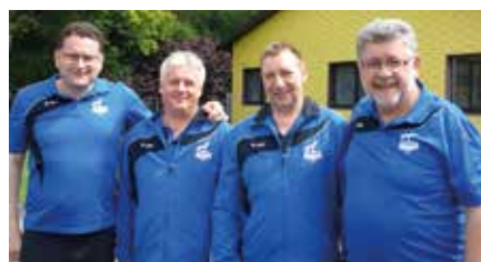
ESC Dingolfing (3.Rang)