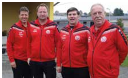
ASK St.Valentin (2.Rang)

N ach 6 Stunden hart umkämpfter Spiele konnte sich die Mannschaft der ASKÖ Schwertberg vor ASK St. Valentin und ESC Dingolfing aus unserer Partnerstadt durchsetzen und den Turniersieg bzw. den Wanderpokal mit nach Hause nehmen.