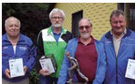
ASKÖ Schwertberg (1.Rang)