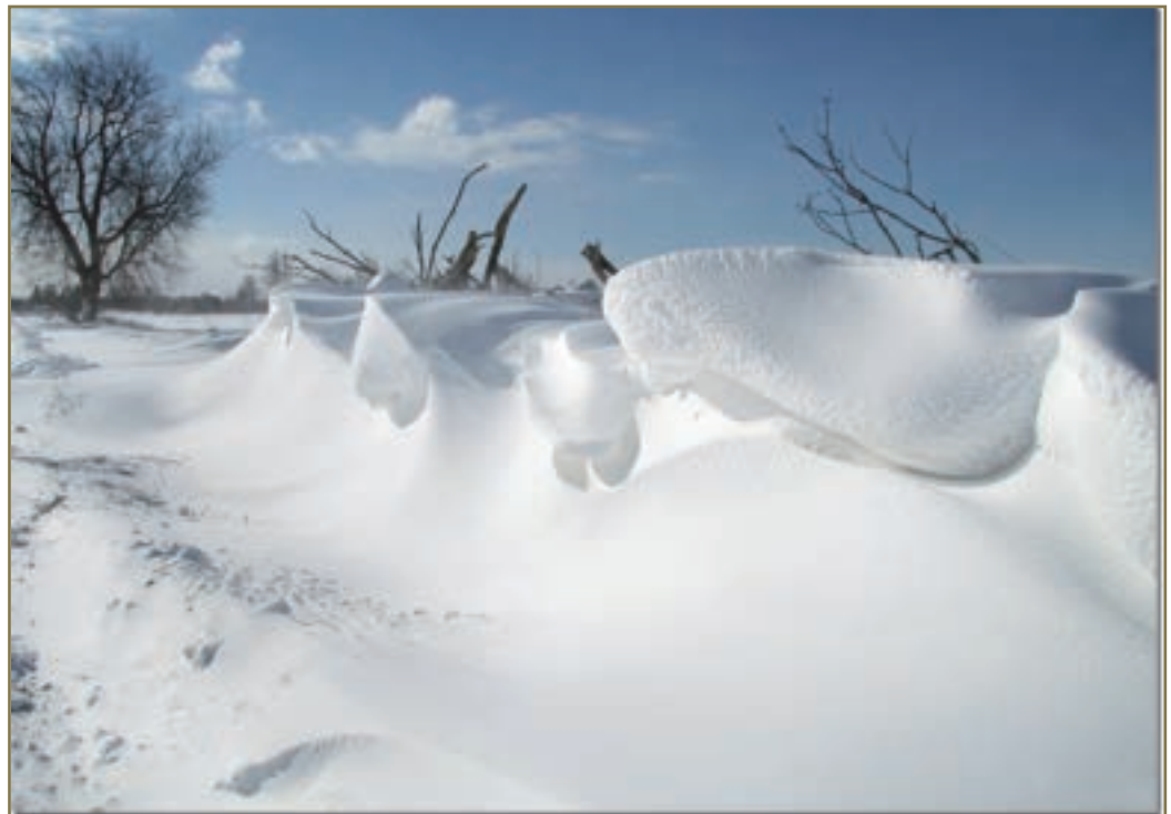
Schneeverwehungen sorgen für unpassierbare Straßen, Unterbrechung des Zug- und Flugverkehrs, Störungen bei der Stromversorgung, Erhöhung der Dachlasten und steigern die Lawinengefahr.

Schneeverwehungen sorgen vor allem in den eher flachen Bezirken für unpassierbare Straßen. In den gebirgigen Regionen steigt dadurch die Gefahr von Lawinenabgängen.