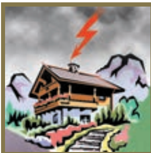
Gebäude mit einer entsprechenden Blitzschutzanlage bieten Sicherheit.