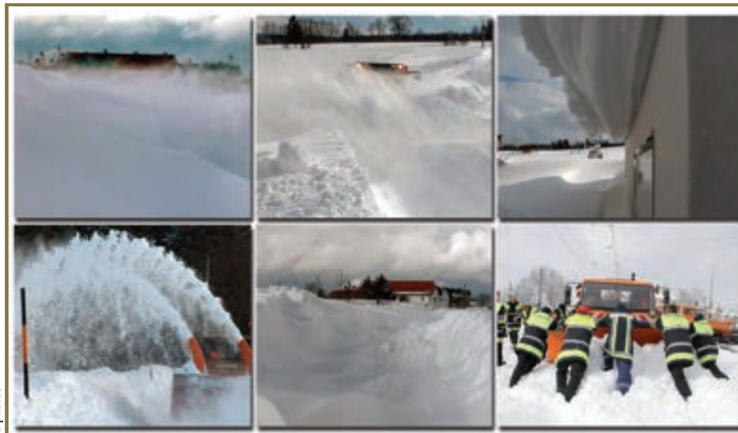
Pulverschnee und Sturm - eine Kombination die starke Schneeverwehungen verursacht.

Weg in den Straßengräben oder sogar gegen einen Baum ist dann vorprogrammiert. Auch durch den Schnee verdeckte und daher unsichtbare Hindernisse wie z.B. Randsteine oder Schlaglöcher haben schon so manches Autoleben verkürzt.