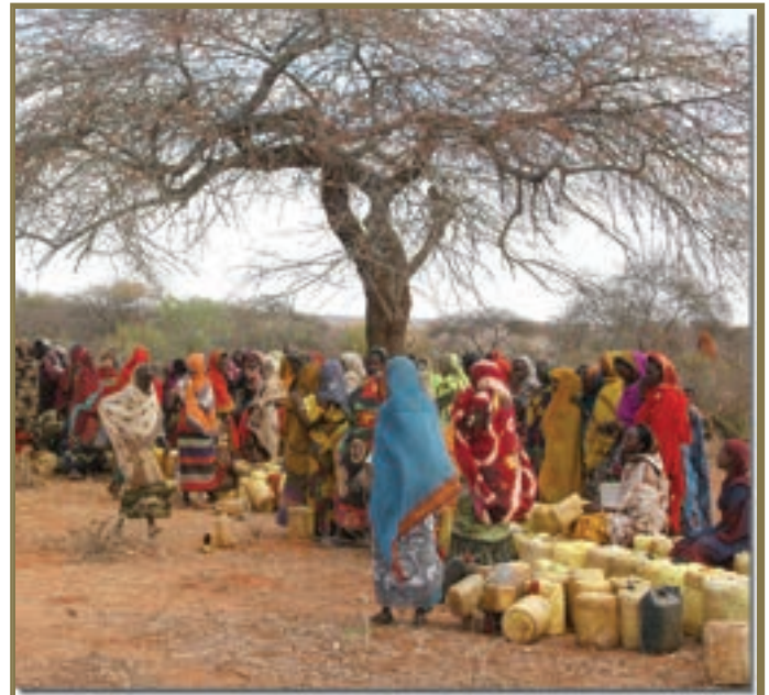
Weltweit irren im Augenblick rund 22 Millionen Umweltflüchtlinge auf der Suche nach Wasser und Nahrung umher. So arg wird es bei uns nicht werden. Das Wasserangebot wird sich zwar jahreszeitlich verschieben, Wasser dürfte jedoch in Österreich nicht allgemein knapp werden.

Die ökologischen Auswirkungen der Trockenheit auf die Landwirtschaft und andere wirtschaftliche Sektoren hängen wesentlich von der Jahreszeit ihres Auftretens ab. So verursacht z.B. Wassermangel in der Wachstumsperiode von Nutzpflanzen oft Ernteinbußen und somit finanzielle Schäden bei den Landwirten, jedoch verursachen Schnee- und Regenmangel im Winter Trockenschäden in der Forstwirtschaft. Trockenheit und Hitzeperioden fallen häufig zusammen, wodurch die Wassertemperatur in den Flüssen und Seen ansteigt. Dadurch sinkt der Sauerstoffgehalt und der Schadstoffanteil in den Gewässern nimmt zu. Für viele Wasserorganismen, insbesondere Fische, bedeutet dies Stress und es kommt oftmals zu einem massiven Fischsterben.