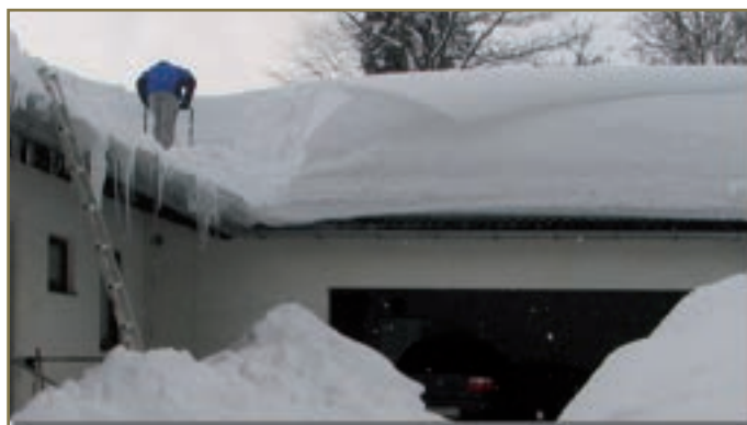
Massive Schneefälle können gewaltige Schneelasten auf den Dächern verursachen. Daher auf die Statik des Dachstuhls Rücksicht nehmen.

Nach einem Winter mit hohen Schneelasten und langer Verweilzeit des Schnees auf dem Dach empfiehlt es sich, den Zustand der Dachkonstruktion von einem Fachmann überprüfen zu lassen. Dies gilt insbesondere dann, wenn die Dachkonstruktion bereits