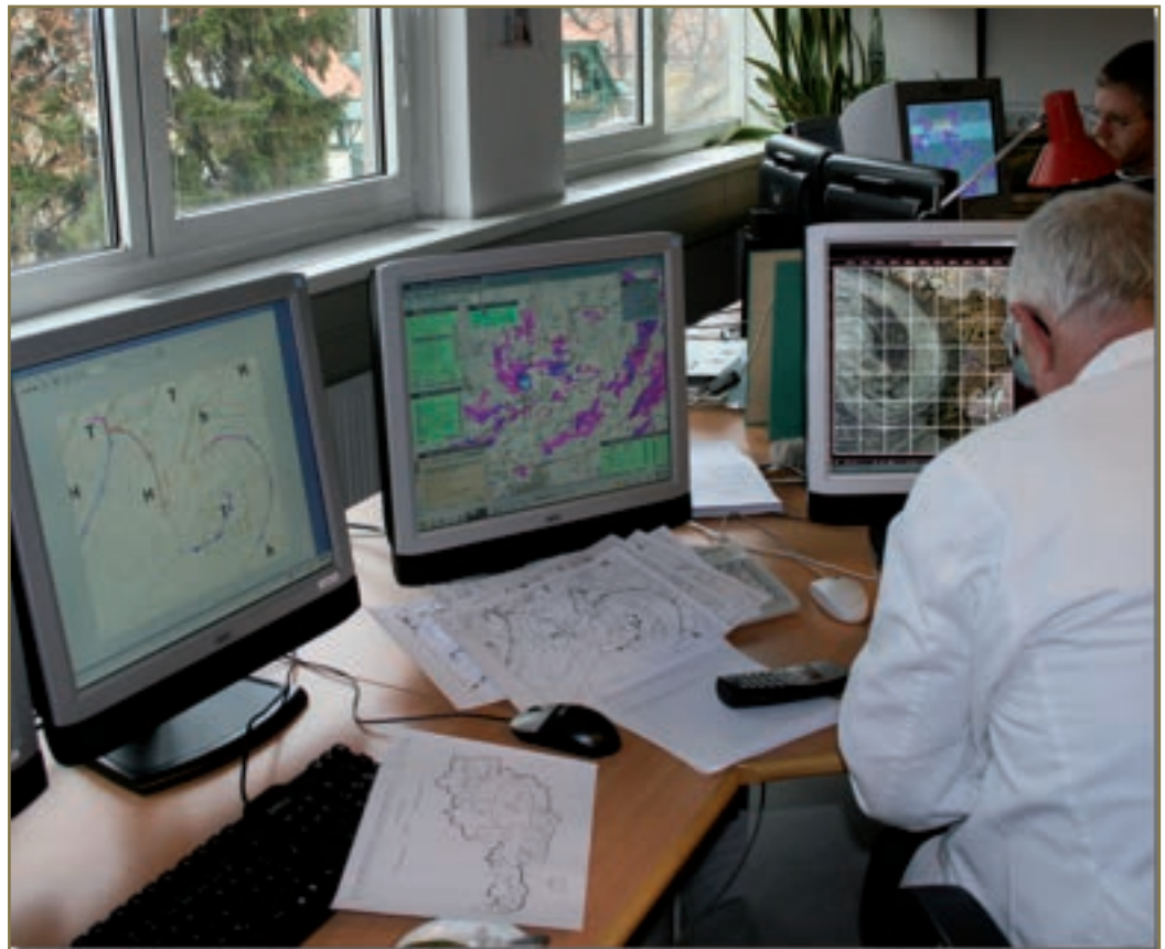
Durch den Einsatz moderner Wetter-Beobachtungssysteme werden die Wetterprognosen immer genauer und die Unwetterwarnungen immer exakter. Besonders für Einsatzkräfte, Behörden aber auch für die Bevölkerung ergeben sich dadurch neue Möglichkeiten und Chancen für präventive Sicherheitsmaßnahmen.

Bei einem unverminderten Ausstoß von Treibhausgasen wird am Ende dieses Jahrhunderts mehr als die Hälfte der heute vertretenen Tier- und Pflanzenarten in vielen Gebirgsregionen Europas keine Lebensgrundlage mehr haben. So könnte es