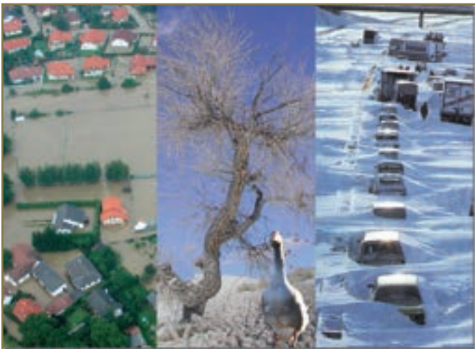
Auch in Niederösterreich werden Hochwasser, Dürre, Waldbrände, Stürme, Schneechaos und andere Unbilden wohl immer mehr zu einem fixen Bestandteil des Jahres.

rechtzeitige Umstellung ist es noch möglich gegenzusteuern, um die Schäden in der Zukunft zu verringern.