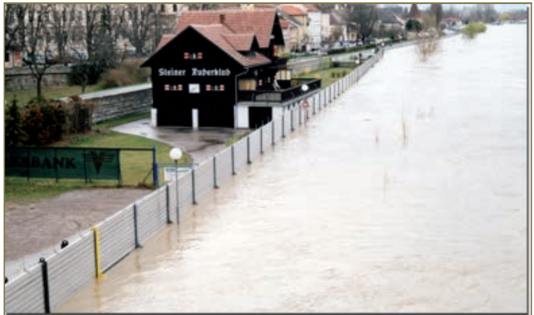
Der mobile Hochwasserschutz in Krems und Stein wird von der örtlichen Feuerwehr bei drohendem Hochwasser aufgebaut und er hat schon mehrmals große Schäden verhindert. Ein typisches Beispiel öffentlicher Vorsorge von Donaugemeinden.

Dass selbst außerhalb der Zone von 100-jährlichem