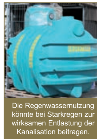
Die Regenwassernutzung könnte bei Starkregen zur wirksamen Entlastung der Kanalisation beitragen.

den. Dadurch würde in Extremsituationen weniger Niederschlagswasser in die Flüsse gelangen und so könnten Überschwemmungen verhindert oder zumindest gemindert werden.