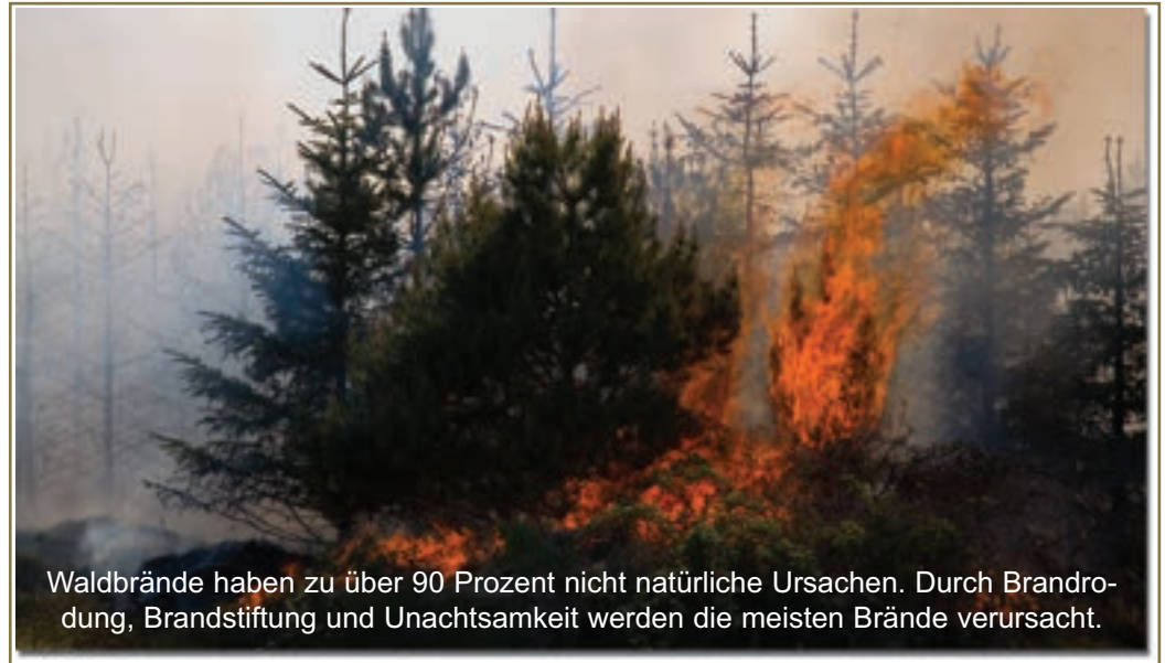
Waldbrände haben zu über 90 Prozent nicht natürliche Ursachen. Durch Brandrodung, Brandstiftung und Unachtsamkeit werden die meisten Brände verursacht.

So gewaltige Waldbrände wie sie zum Beispiel in Portugal, Italien oder Griechenland vorkommen, sind bei unserer Waldzusammensetzung und unseren klimatischen Verhältnissen kaum vorstellbar. Jedoch kann es bei längeren Trockenperioden auch in Österreich leicht zu