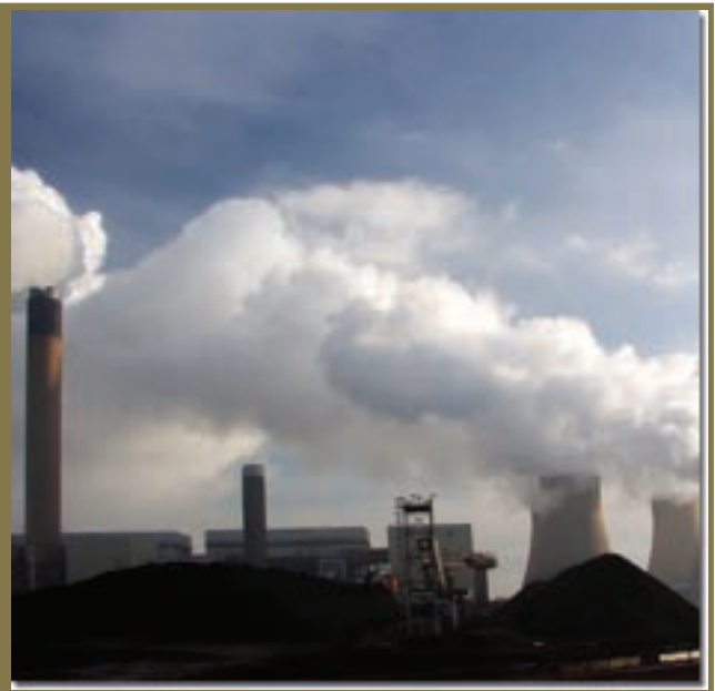
Creative Commons-licensed photos

Energie ist der Motor jeder Zivilisation, jedoch zerstört der zügellose Verbrauch von fossilen Brennstoffen wie Öl, Kohle und Gas unsere Lebensgrundlagen. Unser zukünftiges Handeln bestimmt wie wir unseren Nachkommen die Erde hinterlassen werden. Das Eindämmen der Klimaerwärmung verursacht aus heutiger Sicht große Energieprobleme. Die Lösung für unser Klimaproblem steht am Himmel und ist nicht unter der Erde zu finden. Unsere Sonne gibt uns täglich 15.000-mal mehr Energie als alle Menschen verbrauchen.