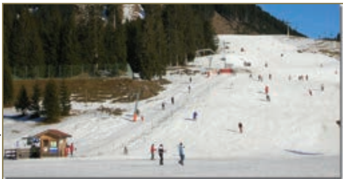
Schneemangel ist für Wintersportler gefährlich und für den Wintertourismus schädlich. Für Hausbesitzer und Autofahrer jedoch ein Sicherheitsgewinn.