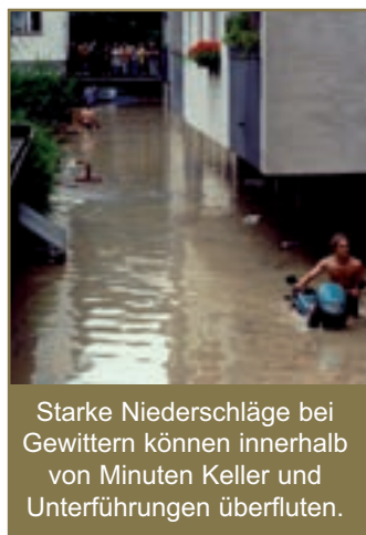
Starke Niederschläge bei Gewittern können innerhalb von Minuten Keller und Unterführungen überfluten.

Von Starkregen spricht man zum Beispiel bei einer Menge von 10 mm Niederschlag je Stunde. Starkregenereignisse können jedoch auch wesentlich heftiger ausfallen.