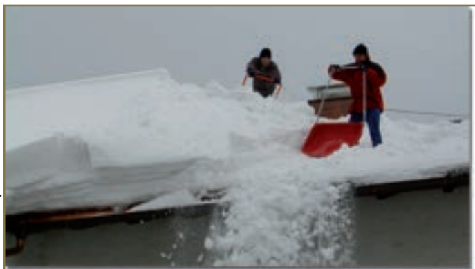
Wer sein Dach trotz großer Schneemassen nicht abschaufelt, kann im Schadensfall den Versicherungsschutz verlieren. Es würde die Sorgfaltspflicht verletzt.